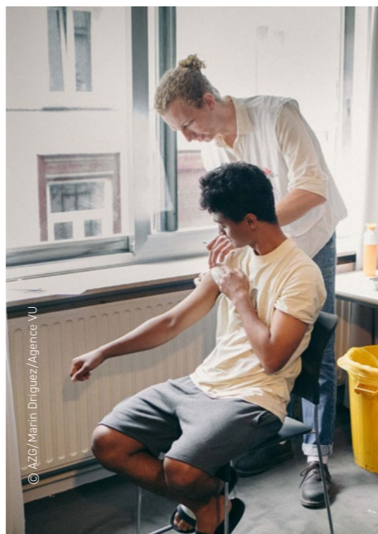
Vaccinatie tegen mazelen in België.

In Brussel en Wallonië is het duolegaat wel nog interessant.