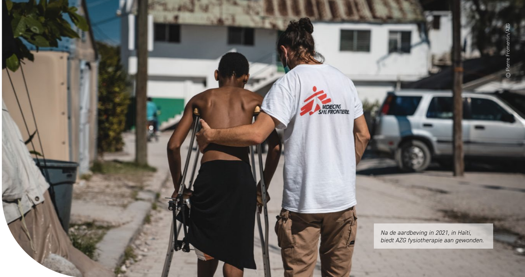
Na de aardbeving in 2021, in Haïti, biedt AZG fysiotherapie aan gewonden.