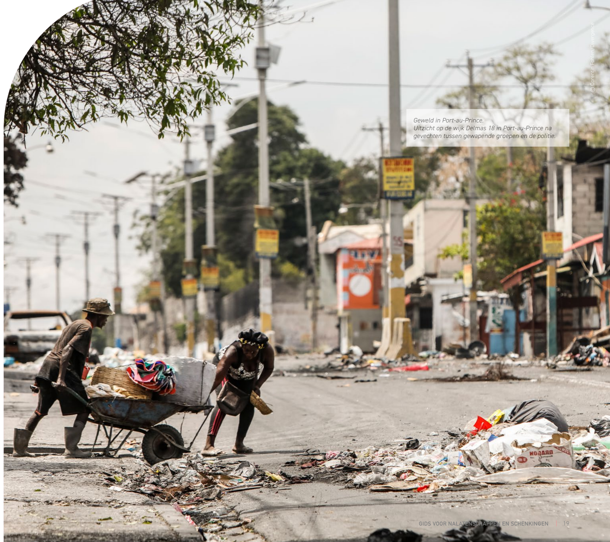
Geweld in Port-au-Prince. Uitzicht op de wijk Delmas 18 in Port-au-Prince na gevechten tussen gewapende groepen en de politie.

Patiënte en overlevende van seksueel geweld in Port-au-Prince, Haïti