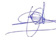
Kristel Eerdeken Adjunct-directeur Artsen Zonder Grenzen

Zo maakt u overal ter wereld medische zorg mogelijk. Ook in de toekomst.